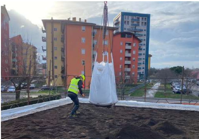
Posa del substrato di coltivazione