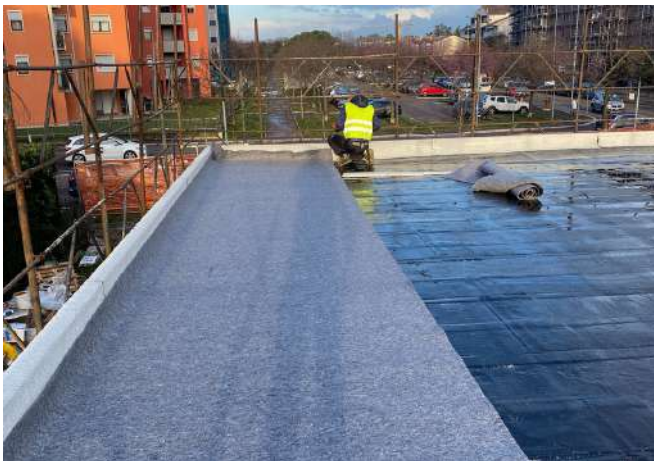
Posa di telo di protezione

Nelle immagini che seguono vengono riportate alcune fasi per l'installazione di un verde pensile estensivo. L'installazione del pacchetto del verde pensile viene sempre eseguita successivamente alla verifica della corretta posa della guaina che deve essere certificata anti-radice.