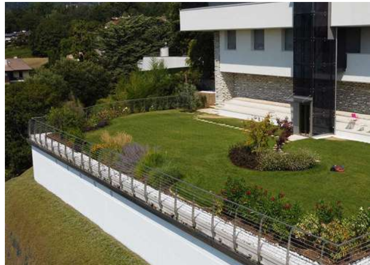
Verde pensile intensivo a tappeto erboso e arbusti

I tetti verdi estensivi presentano una struttura sottile, sono a bassa manutenzione e sono in grado di ospitare forme di vegetazione autosufficienti tra cui Sedum e prati fioriti. Il tetto diventerà una preziosa superficie di compensazione ambientale. Richiede una bassa manutenzione (da 1 a 3 interventi l'anno).