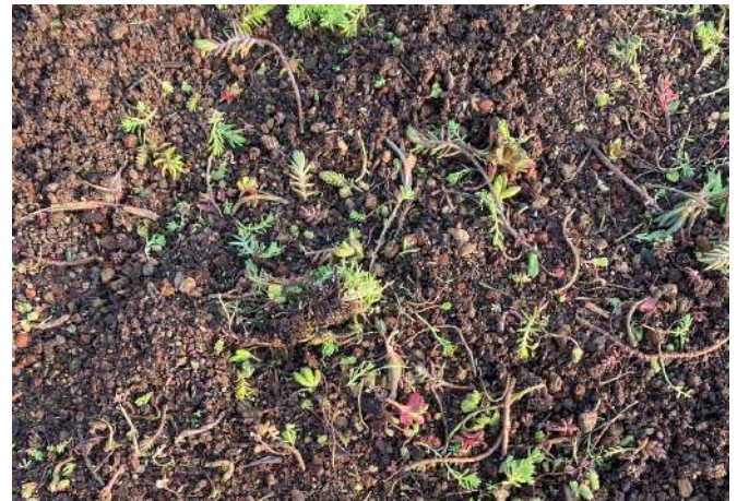
Semina (in questo caso di talee di Sedum)