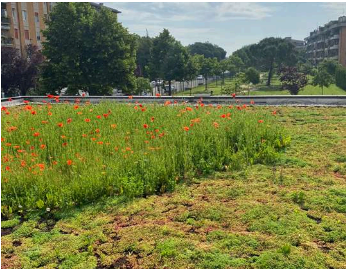
Verde pensile estensivo a sedum e prato fiorito

Bio Soil Expert supporta la progettazione nella scelta dei pacchetti e del materiale vegetale, oltre che della fornitura degli stessi, comprendendo anche la posa.