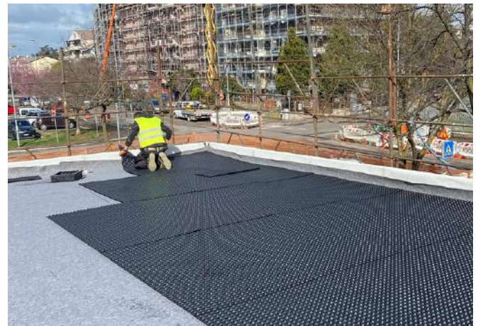
Posa del sistema accumulo e drenaggio